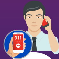
Dificultad para hablar